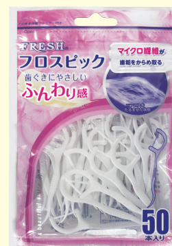
フレッシュフロスピック