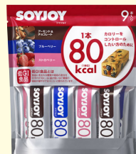
ソイジョイ カロリーコントロール80