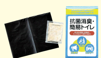
抗菌消臭・簡易トイレ