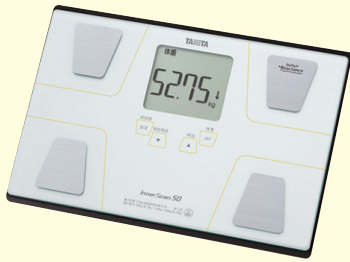
タニタ体組成計 インナースキャン50