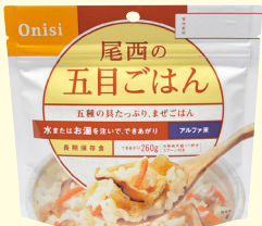
尾西の五目ごはん