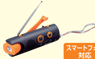
ダイナモ スウィングライトラジオ