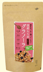
国産 もち麦グラノーラ プレーン