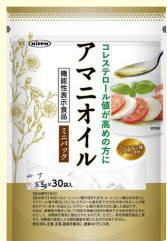
アマニオイル ミニパック