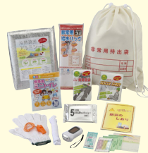
レジャー・防災用15点セット