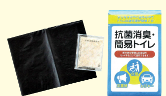
抗菌消臭・簡易トイレ