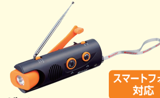
ダイナモ スウィングライトラジオ